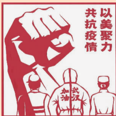
以美聚力 共抗疫情 剪纸/严晓林