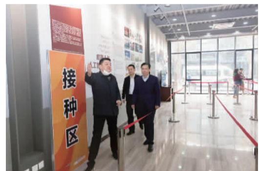
调，要加强现场接种人员指引，减少群众等候时间，避免人员聚集。张庙新冠疫苗接种点的建成凝聚了区、属地政府的心血和努力，要做好广泛宣传、组织动员，最大限度发挥点位优势，惠及周边百姓，共同构筑免疫屏障。